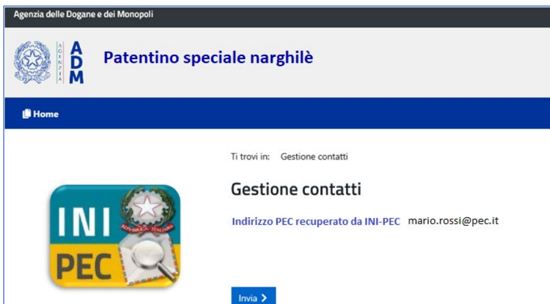
Figura 1 - Gestione contatti

Dopo aver avuto accesso il sistema proporrà all'utente (Figura 1) l'indirizzo di Posta Elettronica Certificata (PEC, nel seguito) recuperato dal registro INI-PEC (Indice Nazionale degli Indirizzi di PEC istituito dal Ministero dello Sviluppo Economico).