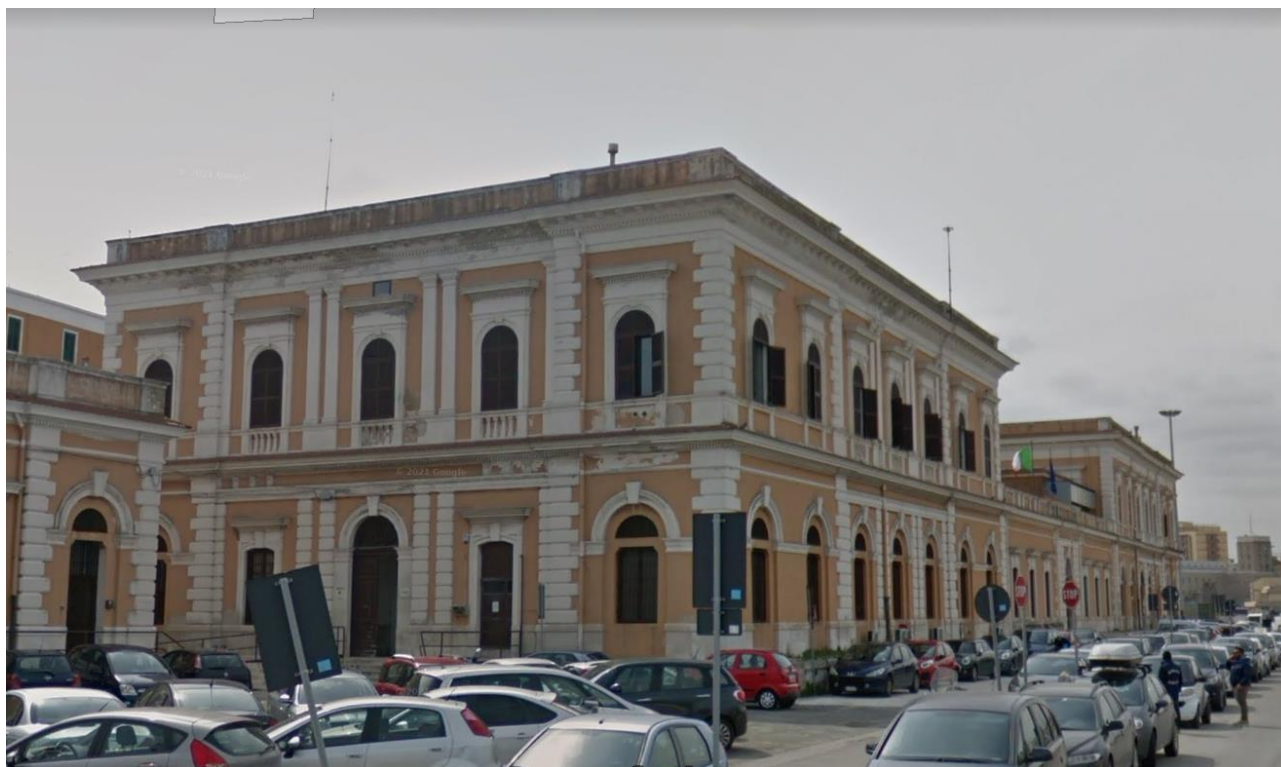
Fig.1 - Palazzo delle Dogane di Bari