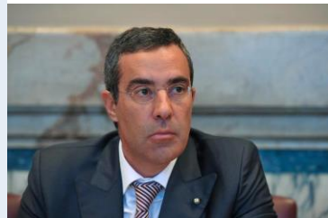
Direttore dell'Agenzia Cons. Roberto Alessi

ADM è autorità regolatoria, di vigilanza e di controllo, con poteri anche sanzionatori, nel campo delle Dogane, Energie (oli minerali, energia elettrica, gas naturale, GNL, carbone), Alcoli, Tabacchi e assimilati e Gioco pubblico. In tali ambiti, cura l'accertamento e la riscossione dei tributi ed esercita le funzioni di polizia tributaria e giudiziaria.