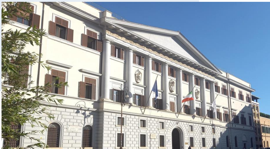
Sede della Direzione Generale Piazza Mastai 12, Roma